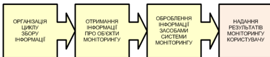
Рис. 3. Загальна модель системи моніторингу (СМ) [2]

Слід зазначити, що незалежно від предметної області модель побудови системи моніторингу має такий загальний вигляд (рис. 3).